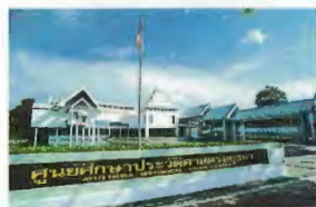
3. Centre d'Etudes historiques d'Ayutthaya 17 km du Pont Naresuan Tarif d'entrée 100 Bahts lundi - vendredi 9h00-16h30 et du week-end 9h00 - 17h00..... G8

Ce monastère abrite « Phra Budhha Trirattana Nayok » ou « Luang Pho To », l'image du Bouddha dorée la plus haute du pays. Le temple vieux de 600 ans, fut construit 26 ans avant l'avènement d'Ayutthaya.