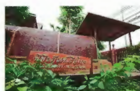
10. Musée des vaisseaux thaïs 1.5 km du Pont Naresuan..... G6

Ce temple est typique de l'architecture de l'époque, le plus beau visible de nos jours, dans un état parfait de conservation. Il est également loué pour son emplacement idéal au bord de la rivière Chao Phraya. Le stupa principal fut construit après la mode de style khmer en différant en ce sens du mythique Khao Phra Sumen, orné de stupas mineurs. Une telle disposition rappelle Angkor Wat au Cambodge. Ce Temple, est un de ceux les plus visités, offrant une vue magnifique du coucher du soleil derrière le stupa principal.