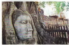
6. Wat Mahathat 2 km du Pont Naresuan Tarifs d'entrée 30 Bahts 08h30 - 16h30 ..... G6

le temple doté de l'architecture la plus complexe en Asie. Bien que cet édifice ait été ravagé par les flammes lors de la deuxième prise d'Ayutthaya, quelques réminiscences de sa beauté majestueuse demeurent visibles. Les trois pagodes alignées dans les enceintes sont devenues le symbole le plus reconnaissable d'Ayutthaya. En face du temple réside Wihan Phra Mongkhon Bophit qui protège une des images du Bouddha en bronze les plus grandes de la Thaïlande.