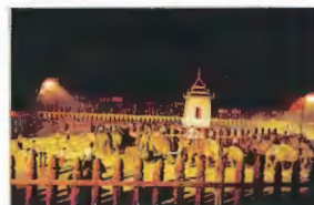
8. Kraal Royal d'éléphants 3 km du Pont Naresuan..... H3

A l'intérieur des murs de ce temple se trouve le stupa le plus intact qu'on puisse trouver dans la capitale et dans lequel sont conservées des reliques du Bouddha et des ustensiles royaux en or inestimables. C'est aussi la voûte la plus large que l'on ait découverte à Ayutthaya (aujourd'hui, tous les ornements en or sont préservés au musée national Chao Sam Phraya). Dans le stupa, il existe un escalier qui mène à un cachot plus bas, décoré par d'antiques fresques murales.