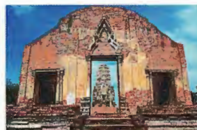
7. Wat Ratchaburana 2 km du Pont Naresuan Tarifs d'entrée 30 Bahts 8h30 - 16h30 ..... G6

Quelque temps après la fondation de la capitale, ce monastère fut choisi comme Temple de la ville et s'y déroulaient de nombreux rituels royaux. Le stupa principal s'est écroulé à l'époque du roi Songtham et désormais, seule l'empreinte de sa base laisse deviner sa hauteur initiale. Le stupa est encerclé de plusieurs pagodes de différentes formes, qui symbolisent les tendances architecturales de chaque période. Une des images la plus spectaculaire est celle de la tête du Bouddha recouverte de racines d'anciens figuiers proche de la chapelle centrale.