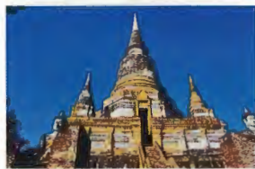
1. Wat Yai Chaimongkhon 2 km du Pont Naresuan Tarif d'entrée 20 Bahts 08h30 - 16h30..... L10

La structure la plus remarquable de ce Temple est son stupa ayant la forme d'une cloche, érigé sur une base octogonale, visible même de loin. Ce Temple fut construit pendant le règne du roi Naresuan le Grand, afin de commémorer sa victoire sur le Dauphin Birman, vaincu à dos d'éléphant, au district Nong Sarai, province de Suphan Buri, il reste un symbole du triomphe et de la fierté pour les autochtones.