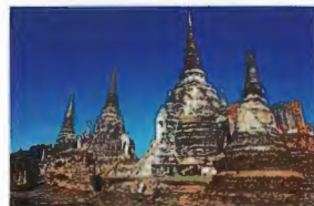
5. Wat Phra Si Sanphet- Le Grand Palais - Wihan Phra Mongkhon Bophit. 15 km du Pont Naresuan Tarifs d'entrée 30 Bahts 07h00 - 18h00 ..... E6

de Bouddha parmi les plus anciennes trouvées dans le Temple Thammikarat et un panneau frontal en bois du temple Phra Si San Phet.