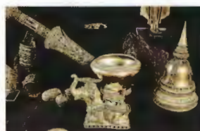
4. Musée National Chao Sam Phraya 2 km du Pont Naresuan Tarifs d'entrée 30 Bahts mercredi - dimanche 9h00-16h00 E8

multimédia, le centre illustre à travers des vidéos et diverses répliques, la grandeur qui fut un jour celle de cette capitale, prenez le temps d'admirer particulièrement les répliques du Grand Palais et du Temple Phra Si Sanphet dans l'état précédant sa destruction par l'invasion birmane. La visite de ce centre est fortement conseillée à ceux qui désirent comprendre et avoir un aperçu de ce que fut l'ancienne capitale.