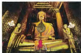
2. Wat Phanancheong 1.5 km du Pont Naresuan Tarif d'entrée 20 Bahts 07h00 - 18h00..... I10

La structure la plus remarquable de ce Temple est son stupa ayant la forme d'une cloche, érigé sur une base octogonale, visible même de loin. Ce Temple fut construit pendant le règne du roi Naresuan le Grand, afin de commémorer sa victoire sur le Dauphin Birman, vaincu à dos d'éléphant, au district Nong Sarai, province de Suphan Buri, il reste un symbole du triomphe et de la fierté pour les autochtones.